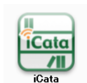
デジタルカタログイメージ

また、iPad、iPhone、アンドロイド端末では、専用アプリ「iCata」(相方)にてもご覧いただくことができます。 アプリは無償となっています。 (AppStore、もしくはPlayストアより「iCata」(相方)をダウンロードしてご利用ください。)