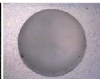
アルミダイキャスト 表